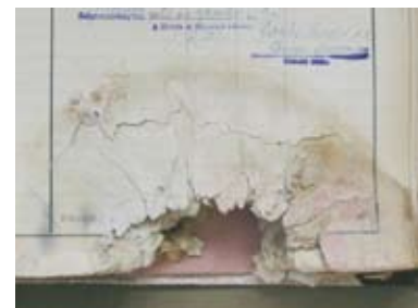
Hallgatói főkönyv restaurálása