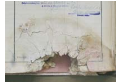
Hallgatói főkönyv restaurálása