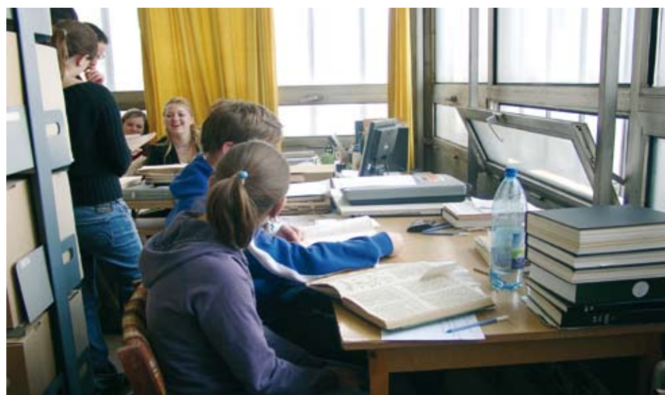
Hallgatók a levéltárban