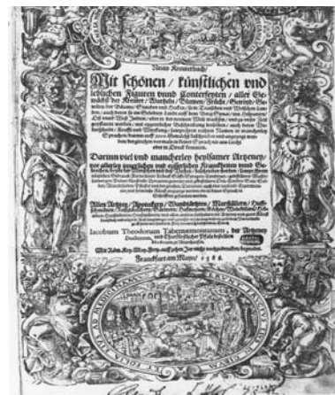
ERDÉSZETI FELSŐOKTATÁS 200 ÉVE | 3 Központi Könyvtár és Levéltár

Az állomány ekkor még Sopronban maradt, mint az Agrártudományi Egyetem Erdőmérnöki Karának, majd az Erdőmérnöki Főiskolának tulajdona.