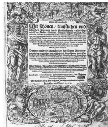
ERDÉSZETI FELSŐOKTATÁS 200 ÉVE | 3 Központi Könyvtár és Levéltár

Az állomány ekkor még Sopronban maradt, mint az Agrártudományi Egyetem Erdőmérnöki Karának, majd az Erdőmérnöki Főiskolának tulajdona.