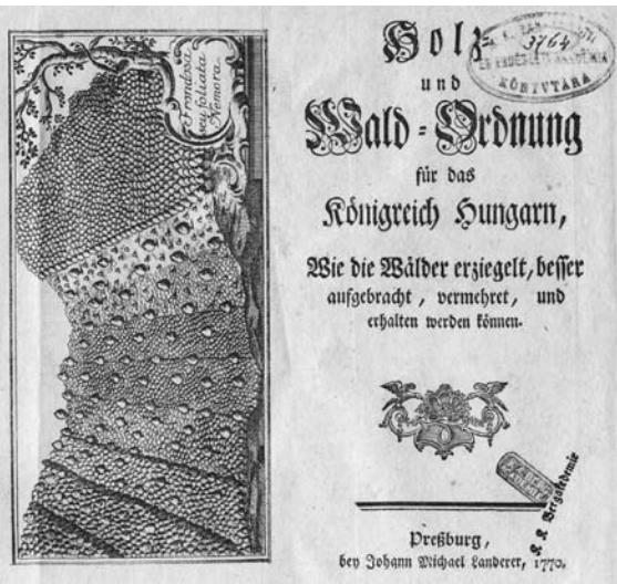
Jocata hic descriptam, mellocum et honorum feram distribuit in perpetua temperate, hinc in Chanam succidi, durareque poterunt.